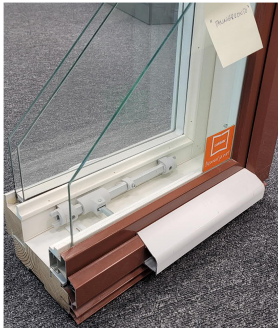
Kuva 5) Vaakaleikkaus puu-alumiini-ikkuna vasemmalla ja kokopuinen ikkuna oikealla.