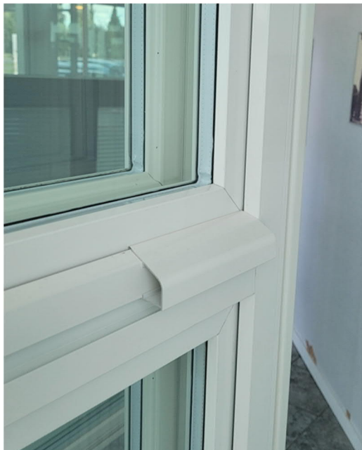
Kuva 4) Lisälista kuvassa lyhennettynä.